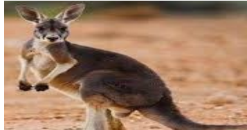
ب) کانگورو : .....

۱۶- پستانداران را براساس چگونگی پرورش جنین به سه گروه تخم گذار، کیسه دار و جفت دار تقسیم می کنند، هر یک از پستانداران زیر جزء کدام گروه می باشد؟