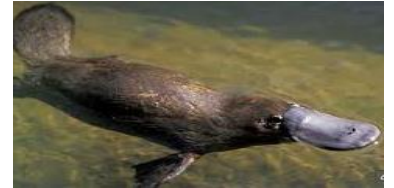
الف) پلاتی پوس : .....